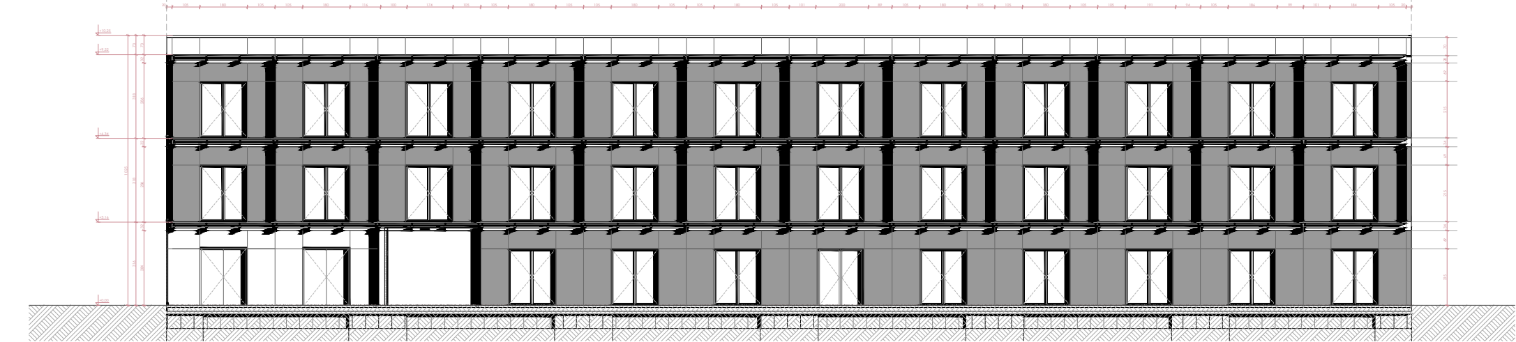
Alçat sud, pell interior